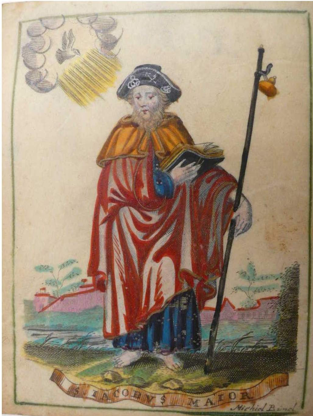
H. Jakobus, Apostel (25 juli)